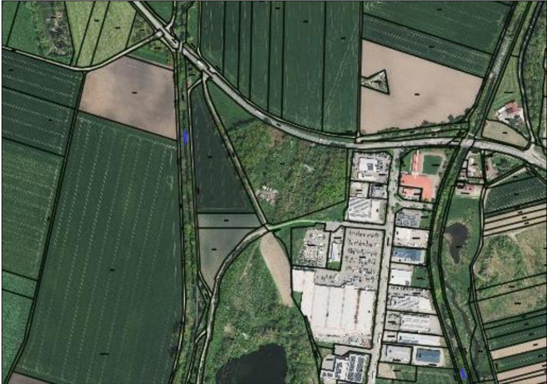
Luftbild des Plangebiets, 2024