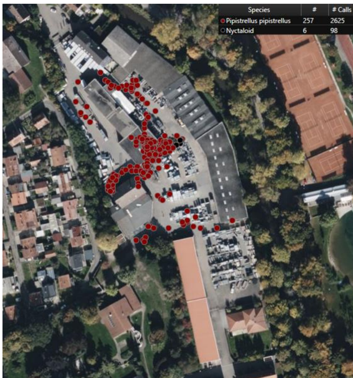
Abb. 4: Fledermausnachweise 2025