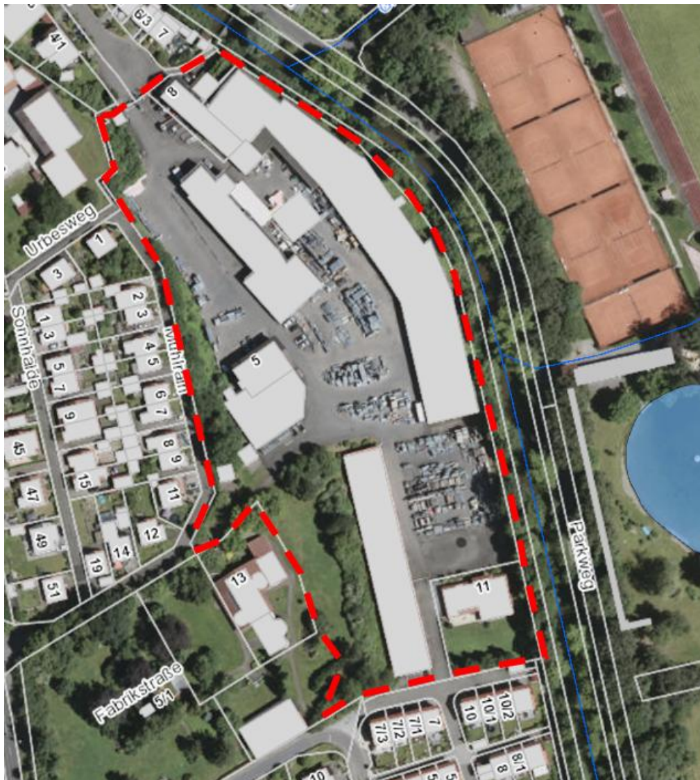
Abb. 1: Lage des Untersuchungsgebietes

Der Betrachtungsraum des Fachbeitrages Artenschutz umfasst den Geltungsbereich und den daran angrenzenden Wirkraum von ca. 25 m. Die Lage des Vorhabensgebietes ist aus Abb. 1 ersichtlich.