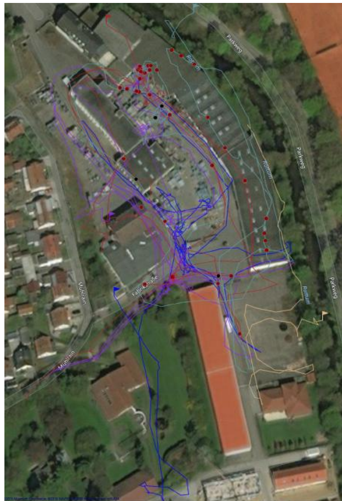
Abb. 3: Fledermausnachweise 2019: rot=Zwergfledermaus, schwarz=Großer Abendsegler