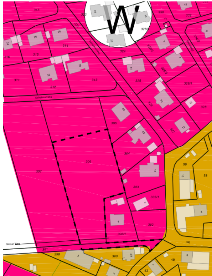
Auszug auf dem FNP 2015

Grundlage für den Bebauungsplan „Grüner Weg - Schalmenweg“ ist der seit dem Jahr 2006 wirksame Flächennutzungsplan der Vereinbarten Verwaltungsgemeinschaft der Stadt Laupheim. Dieser stellt das Plangebiet als Wohnbaufläche da, sodass der Bebauungsplan aus dem Flächennutzungsplan entwickelt werden kann.