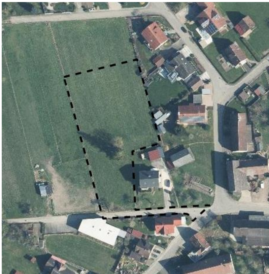
Luftbild des Plangebiets, Frühjahr 2020

Das Plangebiet liegt am westlichen Rand des Ortsteils Obersulmetingen, sodass das Baugebiet künftig den Übergang in die freie Landschaft bildet. Die neu entstehenden Bauplätze schließen an gewachsene Strukturen an. Im Westen grenzen landwirtschaftliche Flächen an, die als Wiesen und Weiden genutzt werden. Vereinzelt finden sich Bestände von Obstbäumen. Im näheren Umkreis, Richtung Westen, liegen zudem zwei landwirtschaftliche Hofstellen. Das Plangebiet steigt von Süden nach Norden leicht an. Zwischen Grüner Weg und Schalmenweg liegt eine Höhendifferenz von ca. 2,5 m.